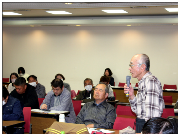
第37回 越労連定期大会

「年金受給日宣言」 現行・年金は毎月ではなく2カ月に1回 年金者組合は毎月の年金支給の実現を求めて運動